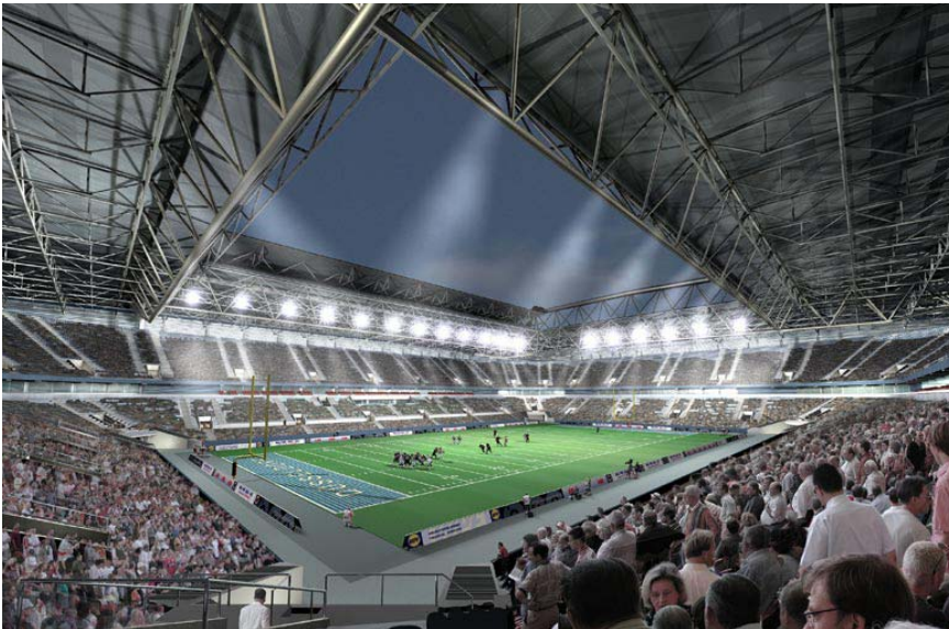
Abbildung: Multifunktionsarena Düsseldorf, visualisiert mit CINEMA 4D von bgp design, Stuttgart

Schalten Sie während einer Animation einfach die Kamera um – schon erhalten Sie die passenden Schnitte, um Ihren Film noch professioneller aussehen zu lassen. Natürlich lassen sich auch alle anderen Objekte, inkl. Beleuchtungseinstellungen animieren. Laufende Menschen und fahrende Autos per Zusatzbibliothek sind mit wenigen Mausklicks hinzugefügt.