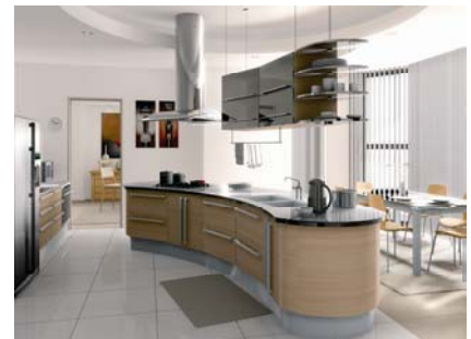
Abbildung: Copyright Infografica Arquitectonica